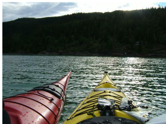
Bilde fra romantisk padletur på Ranfjorden...

Ryktene forteller at på grunn av mildt og fint vær blir det ekstra tidlig oppstart med padlekurs ved Lillealteren.