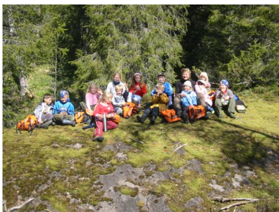
Her er andre klasse på tur oppi lia sist vår

I hvert nummer av Heimhug vil vi komme med forslag til turer på Alteren eller i nærområdene.