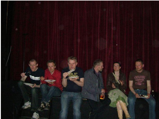
Spekemat på scenekanten

Etter fredagsforestillinga var det duket for pubkveld. En godt forberedt komité serverte. Spekkefat og drikke. Et smekkkfullt lokale og høy stemning bad bud om et populært arrangement.