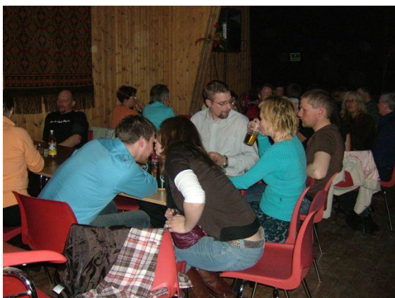
God stemning utover kvelden.