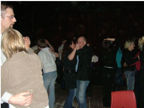
Det ble tilløp til dans utpå kvelden