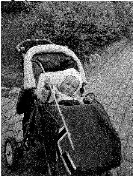
Feiring for store og små!