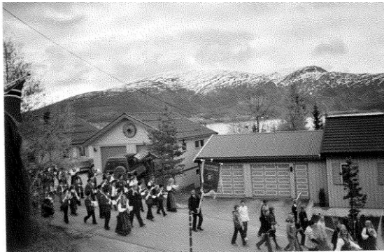
Toget på tur ned Solbakken

Tross dette og surt vært ble det et flott tog etterpå, og det var taknemlig for alle å kunne nyte god mat og drikke inne på skola mens det var aktiviteter for de små ute. Foreldre til 3 og 7ende klasse gjorde en flott innsats i år også.